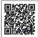
スポーツセンターウェブサイト

申込方法 (1) 電子申請(スポーツセンターウェブサイトからお申し込みください) (2) 電話、来所(県立スポーツセンター・藤沢市善行)、または下記「事前申込書」によりファクシミリでお申し込みください。